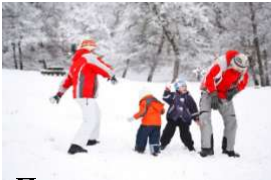
Прогулки на свежем воздухе