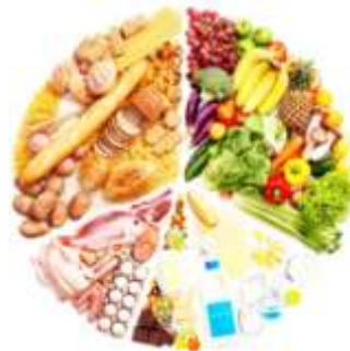
Правильное и здоровое питание