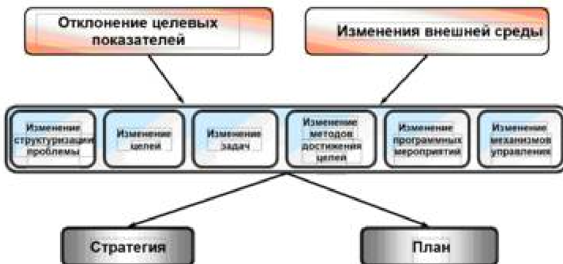
Рисунок 3. Система реагирования на отклонения целевых показателей и изменение внешней среды

В качестве субъектов системы оперативного реагирования выступают государственные органы исполнительной власти Владимирской области, органы местного самоуправления и администрации хозяйствующих субъектов (аппарат управления, менеджеры предприятий и организаций).